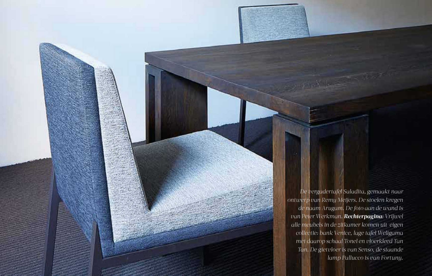
De vergadertafel Saladita, gemaakt naar ontwerp van Remy Meijers. De stoelen kregen de naam Arugam. De foto aan de wand is van Peter Werkman. Rechterpagina: Vrijwel alle meubels in de zijkamer komen uit eigen collectie: bank Venice, lage tafel Weligama met daarop schaal Tonel en vloerkleed Tan Tan. De gietvloer is van Senso, de staande lamp Pallucco is van Fortuny.

‘Het is fijn in een huis te leven dat in balans is’